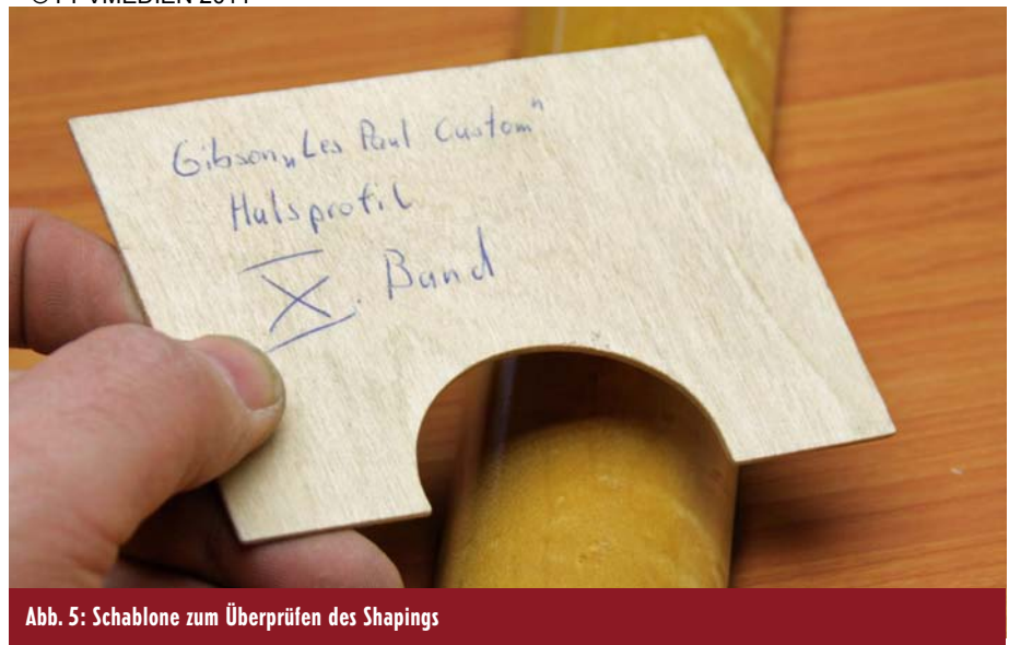
Abb. 5: Schablone zum Überprüfen des Shapings

persönliche Vorlieben, die sich beispielsweise durch das Probenspielen verschiedenster Hälse individuell herauskristallisieren müssen.