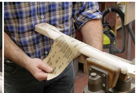
Abb. 8: Die Raspel- und Feilspuren werden mit einem langen Stück Schleifpapier beigearbeitet