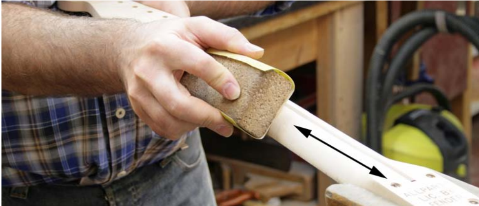
Abb. 9: Feinschliff möglichst in Faserrichtung