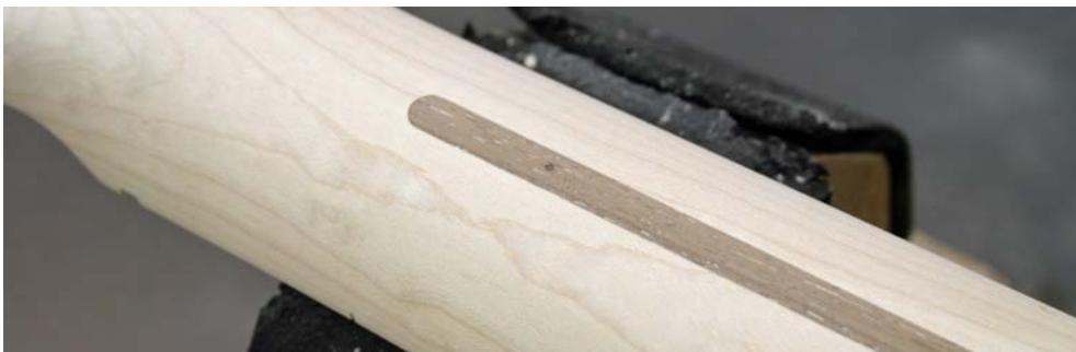
Abb. 10: Fertig geformt, verfüllt und geschliffen – auf zur nächsten Etappe