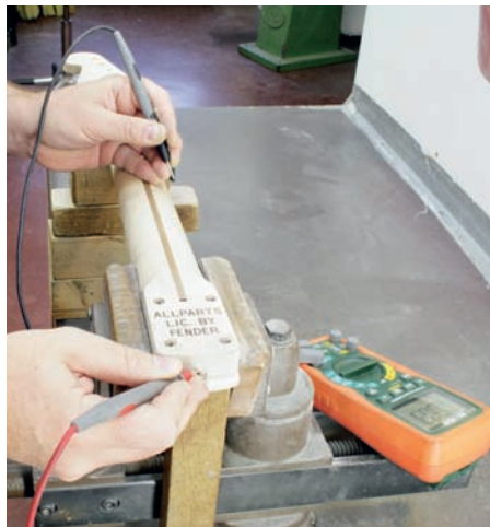
Abb. 3: Treffer: T-Rod gefunden!