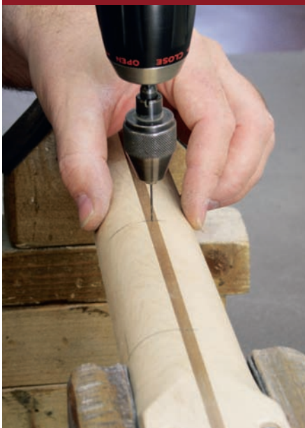
Abb. 2: Fakten schaffen: Anbohren des Halses