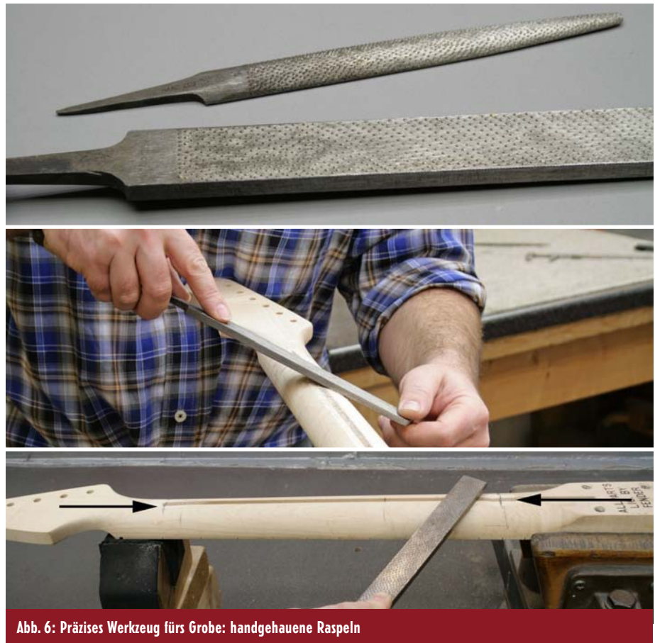
Abb. 6: Präzises Werkzeug fürs Grobe: handgehaute Raspeln

Vorsicht ist jedoch geboten, da sich im Halsinneren der Halseinstellstab (T-Rod) befindet (siehe Abb. 1 ). Nimmt man zu viel vom