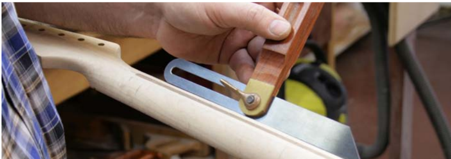
Abb. 7: Um schön in der Flucht zu bleiben: Kontrolle mit der Schmiege

Holz weg, liegt dieser Metallstab plötzlich offen vor den erstaunten Augen, inklusive der großen Frage: Was nun? Um diese irreparable Begegnung zu vermeiden, rate ich dringend dazu, zunächst Fakten zu schaffen. Wo liegt der T-Rod? Extrem hilfreich zeigt hier der Skunk-Stripe auf der Halsrückseite sehr präzise den Kanal des T-Rods an. Und dann ist der Rod auch nicht mehr weit. Am ersten, siebten und zwölften Bund bohre ich mit einem 1-mm-Bohrer ein Loch in Richtung Stahlstab (Abb. 2). Nach wenigen Millimetern trifft der Bohrer auf etwas Hartes – Treffer!