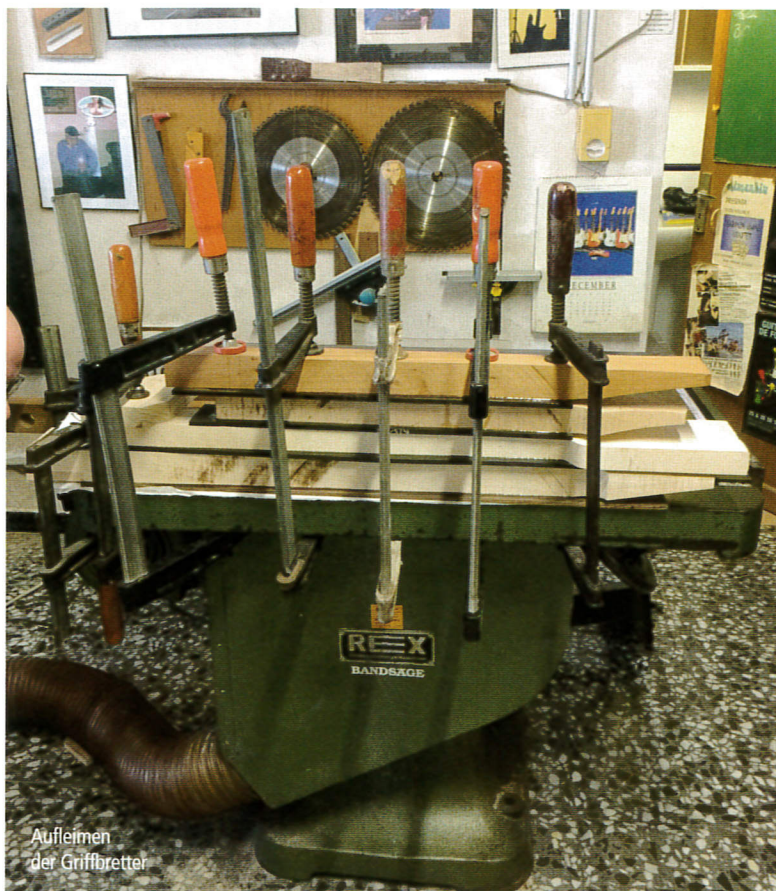
Aufleimen der Griffbretter