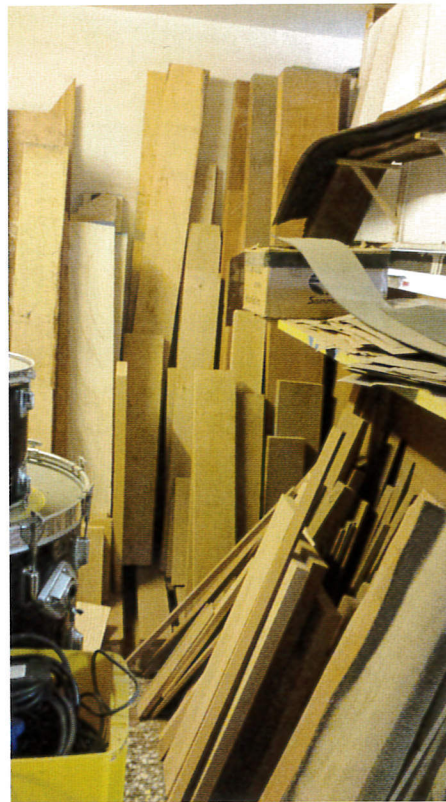
Blick ins Holzlager